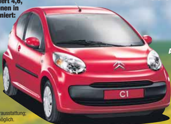
Abb. zeigt Sonderausstattung; gegen Aufpreis möglich.

Kraftstoffverbrauch in l/100 km: innerorts 5,5, außerorts 4,0, kombiniert 4,6, CO 2 -Emissionen in g/km kombiniert: 109 (RL 80/1268/EWG).